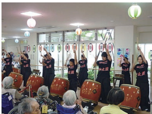
県立神戸鈴蘭台高校の和太鼓クラブによる演奏

8月4日(木)～10(水)(7日(日)を除く)の間、夏祭りを日替わりで開催します。楽しみにしてください。